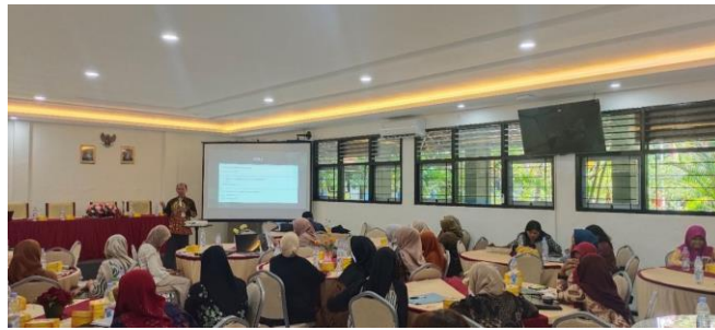
Gambar 3. Praktik Pendaftaran HKI

Berdasarkan hasil analisis kuesioner yang diberikan kepada guru diperoleh data bahwa pengetahuan mitra sasaran tentang HKI menunjukkan 90% responden menyatakan sangat meningkat, sedangkan 10% menyatakan meningkat. Selain itu, 80% mitra sasaran telah memahami proses pendaftaran HKI atas karya para guru, sementara 20% lainnya masih memerlukan pendampingan. Pada akhir kegiatan, tercatat dua orang guru telah berkonfirmasi mengajukan paten sederhana, satu orang berada pada tahap konsultasi merek dagang, dan 18 orang berkonsultasi mengenai HKI karya guru.