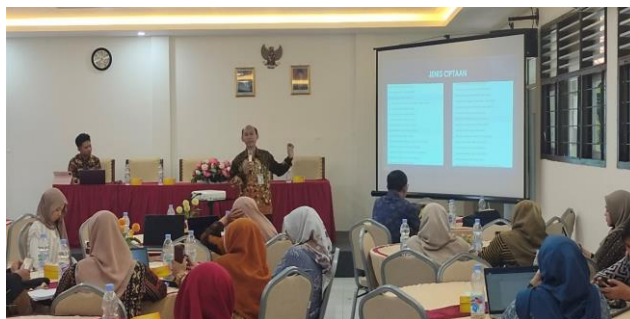
Gambar 2. Pemberian Literasi Pengadministrasian dan HKI

Kegiatan ini diawali dengan mengenalkan pentingnya mengadministrasikan karya guru ( Gambar 2 ). Hal ini karena banyak bukti bahwa selama ini guru tidak pernah mengadministrasikan karya karyanya, padahal karya tersebut dapat diakui dan dilindungi. Kegiatan ini dilakukan dengan memberikan pengetahuan dan cara pengadministrasian karya dengan menggunakan kertas kerja.