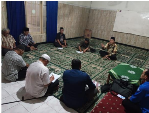
Gambar 3. Sesi Diskusi Kelompok

Dari diskusi kelompok ditemukan fakta bahwa masyarakat selama ini lebih banyak mengikuti keputusan tokoh agama setempat tanpa memahami dasar ilmiah dan fiqhiyahnya (Gambar 3). Dengan adanya ruang dialog, peserta mulai menyadari bahwa perbedaan tersebut seharusnya tidak menimbulkan perpecahan, melainkan dapat dijumpai melalui pendekatan edukasi yang menekankan persatuan umat.