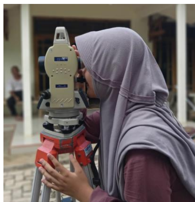
Gambar 4. Sesi Praktik Lapangan

Tahap berikutnya berupa workshop dan studi kasus berhasil menguji kemampuan peserta dalam mengaplikasikan teori yang telah dipelajari. Peserta dibagi ke dalam kelompok untuk menyusun rancangan kalender Hijriyah sederhana berdasarkan metode hisab dan rukyat.