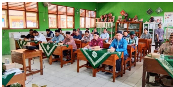
Gambar 2. Sesi Ceramah dan Presentasi

Tahap diskusi kelompok memperlihatkan keterlibatan aktif para peserta dalam bertukar pengalaman dan pandangan. Dengan pembagian kelompok kecil beranggotakan 5-10 orang, diskusi berlangsung dinamis. Beberapa peserta menyampaikan pengalamannya mengikuti tradisi rukyat di daerahnya, sementara yang lain berbagi pandangan mengenai keakuratan metode hisab modern. Diskusi ini tidak hanya menjadi sarana untuk saling memahami perbedaan pandangan, tetapi juga menjadi ruang mediasi yang mempertemukan dua arus besar dalam masyarakat Islam: tradisi rukyat yang berbasis observasi langsung dan metode hisab yang berbasis kalkulasi astronomi.