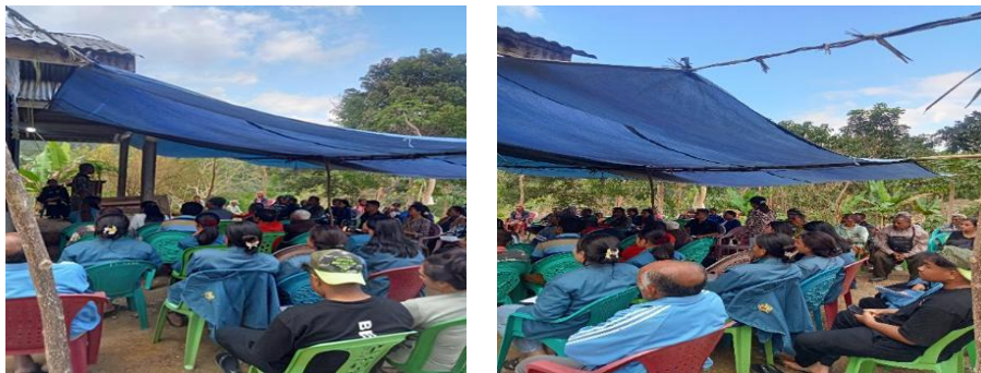
Gambar 2. Pemaparan Materi Sosialisasi

Melalui Modul Defensif 1, fasilitator memulai dengan menjelaskan secara sederhana mandat OJK sebagai lembaga pengawas industri jasa keuangan. Peserta diajak membedakan antara lembaga yang diawasi OJK dan pihak-pihak yang hanya mengaku “mitra” lembaga resmi. Tampilan kanal pengaduan Kontak 157 dan APPK diperlihatkan menggunakan poster dan contoh tangkapan layar. Peserta juga diberi panduan langkah demi langkah untuk mengecek legalitas lembaga keuangan melalui situs resmi OJK. Proses pemaparan materi sosialisasi ditunjukkan pada Gambar 2.