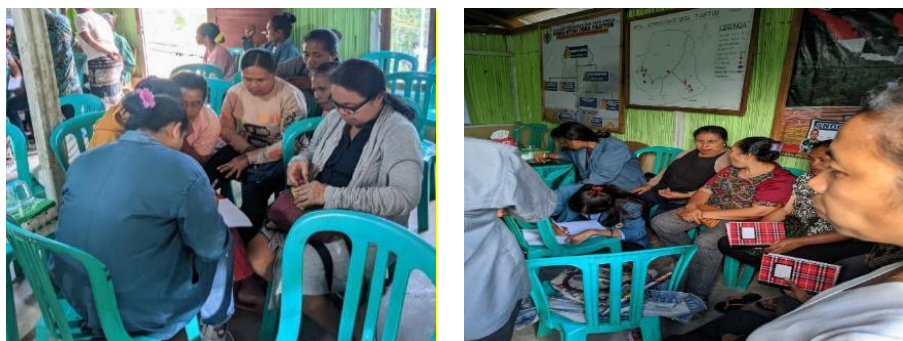
Gambar 3. Dinamika Diskusi Kelompok

Modul Defensif 2 dirancang untuk menjembatani konsep abstrak skema Ponzi dan pengalaman konkret peserta. Fasilitator tidak memaparkan teori skema Ponzi secara teknis, tetapi mengangkat serangkaian ilustrasi lokal yang dekat dengan kehidupan sehari-hari. Contoh yang digunakan antara lain: “tawaran arisan getok” yang mengandalkan perekrutan anggota baru untuk membayar peserta lama, “investasi ternak” dengan janji keuntungan tinggi dan pasti tanpa transparansi usaha, “arisan motor/HP” dengan setoran ringan namun imbal hasil berlapis, serta program “tabungan panen” atau “titip jual hasil panen” dengan janji pengembalian yang tidak realistis. Agar pemaparan materi lebih efektif, para peserta dibagi ke dalam beberapa kelompok diskusi untuk mengidentifikasi pola-pola investasi ilegal berdasarkan contoh kasus lokal. Dalam setiap kelompok, fasilitator mengarahkan peserta untuk membedakan tawaran yang wajar dan tidak wajar dengan menggunakan pendekatan praktis. Proses diskusi dan identifikasi pola red flags oleh peserta ditunjukkan pada Gambar 3.