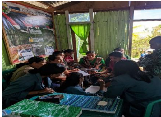
Gambar 4. Kartu Komitmen

Hasil observasi selama sesi menunjukkan antusiasme yang tinggi ketika peserta berdiskusi mengenai pos pengeluaran konkret, seperti biaya sekolah, konsumsi harian, dan kebutuhan upacara adat. Beberapa peserta menyadari bahwa pengeluaran yang selama ini dianggap “kecil” ternyata cukup signifikan jika dijumlahkan dalam satu tahun. Dalam uji lisan acak terhadap 5 peserta, seluruh peserta (100,00%) mampu menjelaskan pentingnya dana darurat, 80,00% mampu menjelaskan perlunya menunda konsumsi non-prioritas, 40,00% mampu menyebut sedikitnya tiga pos kas musiman, dan 80,00% mampu menjelaskan hubungan antara panen, paceklik, dan perencanaan kas. Temuan ini menunjukkan bahwa peserta mulai memahami pengelolaan arus kas musiman sebagai strategi bertahan pada periode tanpa pemasukan. Selain melalui uji lisan, orientasi perubahan perilaku peserta juga didokumentasikan melalui kartu komitmen mikro. Dokumentasi komitmen peserta tentang pengelolaan arus kas musiman ditampilkan pada Gambar 4.