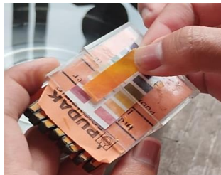
Gambar 2. Pemeriksaan Tingkat Keasaman Larutan Hujan dengan Kertas Lakmus

Gambar 2 merupakan tahap pemeriksaan tingkat keasaman larutan H_2SO_4 dan HNO_3 menggunakan kertas lakmus agar berada pada PH 4 untuk merepresentasikan kondisi hujan asam nyata di lingkungan padat kendaraan. Larutan hujan asam dibuat menggunakan campuran H_2SO_4 dan HNO_3 dengan cara menyiapkan 1 liter Aquades, lalu menambahkan 6 tetes H_2SO_4 dan 2 tetes HNO_3 .