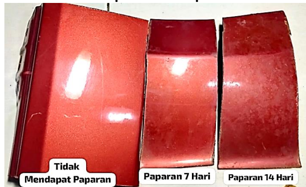
Gambar 8. Perbandingan Antara Yang Tidak Mendapat Paparan Hujan Asam Dengan Sampel Variasi 7 hari Paparan dengan Variasi 14 Hari paparan.