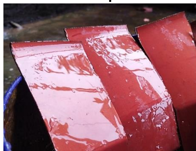
Gambar 4. Berkurangnya Efek Menolak Air Pada Permukaan Cat