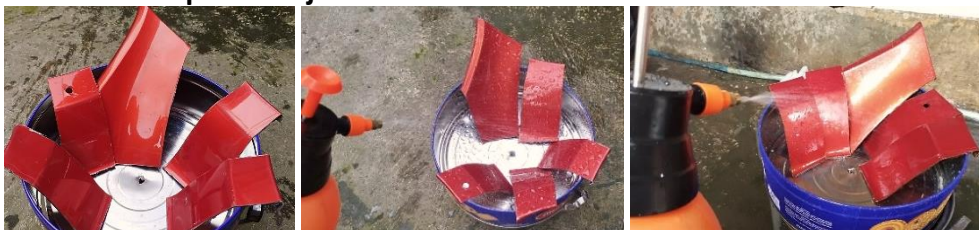
Gambar 3. Proses Simulasi Paparan Hujan Asam