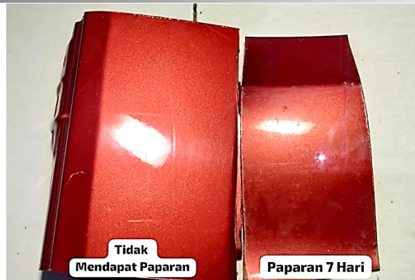
Gambar 6. Perbandingan Antara Sampel Yang Tidak Mendapat Paparan Hujan Asam Dengan Sampel Variasi 7 Hari Paparan