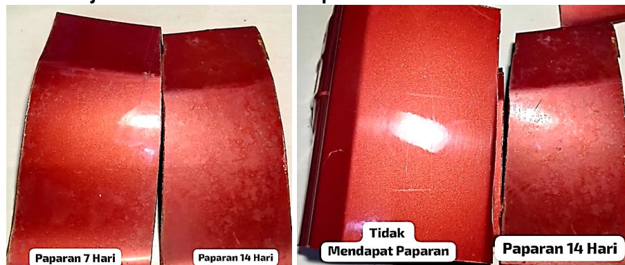
Gambar 7. Perbandingan Antara Sampel Variasi 7 hari dengan 14 hari, dan Perbandingan Sampel Yang Tidak Mendapat Paparan Hujan Asam Dengan Sampel Variasi 14 Hari paparan.