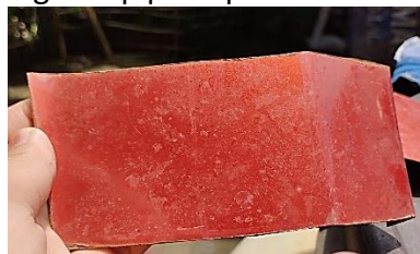
Gambar 5. Munculnya Water Spot Setelah Proses Pengeringan

Hasil atau dampak paparan hujan asam dapat dilihat pada gambar 4. Hari pertama eksperimen sampel menunjukkan gejala kerusakan awal ditandai dengan berkurangnya efek menolak air atau hydrofobic pada permukaan cat. Kondisi tersebut akan berdampak buruk terhadap permukaan cat, presipitasi hujan asam tidak langsung mengalir sehingga dapat mengendap pada permukaan cat.