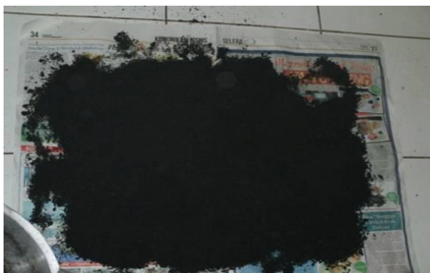
Gambar 1. Biomassa yang telah dihaluskan