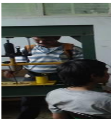
Gambar 3. Proses memadatkan (press) bahan baku briket

Selanjutnya pada gambar 2 adalah proses penimbangan bahan baku serta penambahan bahan perekat seperti tepung tapioka dan air untuk memperoleh komposisi campuran yang homogen. Proses ini sangat penting karena perbandingan komposisi bahan akan mempengaruhi sifat fisik dan kimia briket yang dihasilkan.