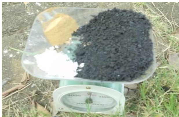
Gambar 2. Proses menentukan berat serta campuran bahan perekat briket

Gambar 1 menunjukkan tahapan proses pembuatan briket biomassa berbahan dasar limbah kulit jagung yang dilakukan secara bertahap. Pada tahap awal, kulit jagung yang telah melalui proses karbonisasi dihaluskan hingga menjadi serbuk arang dengan ukuran partikel yang seragam. Tahap ini bertujuan untuk meningkatkan luas permukaan bahan sehingga mempermudah proses pencampuran dan meningkatkan kualitas pembakaran.