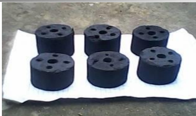
Gambar 4. Hasil akhir briket model sarang tawon

Setelah proses pencetakan, briket dikeringkan hingga mencapai kondisi stabil sebelum digunakan. Hasil akhir dari proses ini ditunjukkan pada gambar 4, yaitu briket biomassa berbentuk silinder berlubang (sarang tawon) yang siap digunakan sebagai bahan bakar alternatif. Bentuk geometris ini dirancang untuk meningkatkan sirkulasi udara selama proses pembakaran sehingga menghasilkan pembakaran yang lebih efisien dan stabil.