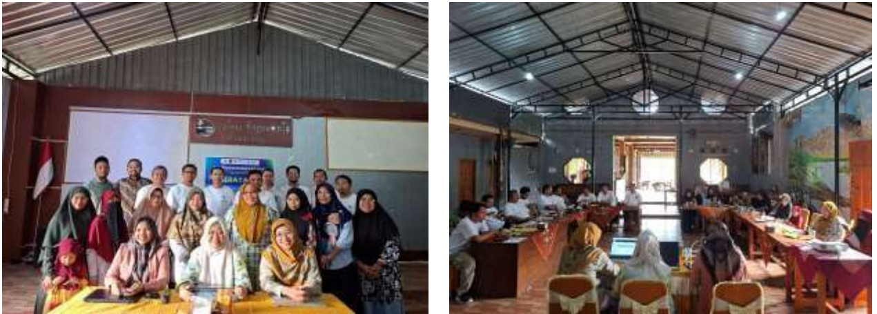
Gambar 2. Pelaksanaan kegiatan PKM

Secara keseluruhan, kegiatan edukasi legalitas merek ini memberikan manfaat nyata bagi anggota SUMU Purworejo dalam memperkuat aspek hukum usaha mereka. Diharapkan kegiatan serupa dapat terus dilakukan secara berkelanjutan agar semakin banyak pelaku usaha yang memahami pentingnya kekayaan intelektual, sehingga mampu meningkatkan daya saing produk sekaligus mendukung pertumbuhan ekonomi masyarakat.