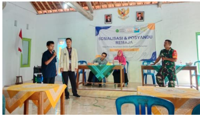
Gambar 2. Sosialisasi Wawasan Kebangsaan