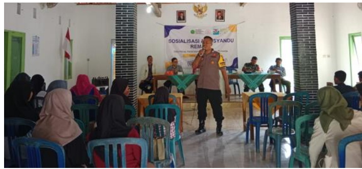
Gambar 1. Sosialisasi Kenakalan Remaja

Terdapat beberapa tindakan yang memungkinkan untuk dilakukan untuk mencegah kenakalan remaja berupa 1) tindakan preventif atau pencegahan seperti mengenal psikologi remaja dan mengetahui kesulitan-kesulitan yang menimbulkan kenakalan sebagai pelampiasan remaja, 2) tindakan represif, yakni usaha menindak pelanggaran norma-norma sosial dan moral dapat dilakukan dengan mengadakan hukuman terhadap setiap perbuatan pelanggaran. Dengan adanya sanksi tegas pelaku kenakalan remaja tersebut, diharapkan agar nantinya si pelaku tersebut “jera” dan tidak berbuat hal yang menyimpang lagi, 3) tindakan kuratif dan rehabilitasi, tindakan ini dilakukan setelah tindakan pencegahan lainnya dilaksanakan dan dianggap perlu mengubah tingkah laku pelanggar remaja itu dengan memberikan pendidikan lagi. Lebih jauh lagi, pemateri memaparkan bahwa dengan adanya kontrol dari orang tua maupun perangkat negara yang terkecil yakni perangkat desa serta koordinasi dengan aparat negara TNI dan Polri, maka tingkat kenakalan remaja dapat ditekan. Beliau juga memberikan gambaran-gambaran bahwa tenaga muda remaja dapat disalurkan melalui kegiatan-kegiatan positif seperti olahraga bola voli karena desa Rebug dikenal dengan tim bola volinya.