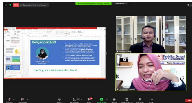
Gambar 3. Diskusi dan Tanya Jawab

Setelah paparan materi dari narasumber, untuk memantapkan konsep dan rencana implementasi dari pembelajaran berbasis HOTS, maka peserta diarahkan untuk melakukan focus group discussion (FGD). Dari hasil FGD dapat disimpulkan bahwa pada dasarnya guru SMK Negeri 1 Kendal sangat mendukung pembelajaran HOTS, karena kebutuhan di era milenial saat ini yang sangat kompetitif, sehingga siswa harus dibekali keterampilan khusus dalam menghadapi tantangan dunia kerja. Kegiatan diskusi dan tanya jawab seperti terlihat pada Gambar 3.