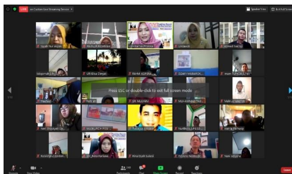
Gambar 1. Peserta Workshop

Kegiatan ini dihadiri oleh tim pengabdian kepada masyarakat fakultas ekonomi dan guru SMK Negeri 1 Kendal. Kepala SMK Negeri 1 Kendal dalam sambutannya menyampaikan untuk lebih mampu meningkatkan kualitas pembelajaran sehingga akan tercipta proses belajar yang menyenangkan dan bermakna ke siswa dalam proses berfikir. Ketua tim pengabdian masyarakat Fakultas Ekonomi Universitas Negeri Semarang melalui sambutannya juga berharap kegiatan ini bisa memberikan kontribusi dan motivasi bagi guru, agar mampu merubah pola pikir dalam memahami pengelolaan pembelajaran serta mampu meningkatkan keterampilan bidang pendidikan. Workshop ini dihadiri sejumlah 31 orang. Adapun peserta workshop yang dilakukan secara daring melalui zoom meeting seperti tampak pada Gambar 1 .