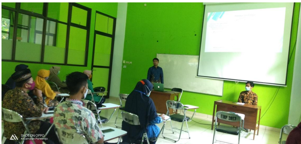
Gambar 2. Kegiatan pendampingan strategi sistem konsultasi terprogram pada Kelompok Kerja Guru SD Muhammadiyah pada Masa Pandemi

Apabila kiat-kiat dalam berfikir kritis, kreatif, dan solutif dalam pemecahan masalah di atas diterapkan dalam proses pembelajaran di kelas 4 Sekolah Dasar sehari-hari, maka daya berfikir kritis, kemampuan berfikir kreatif dan solutif dalam pemecahan masalah oleh anak peserta didik dapat meningkat dan hal ini timbul dari rasa kepercayaan diri akan argument yang dibangun secara mandiri. Kegiatan dapat disajikan pada Gambar 2 .