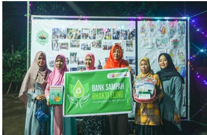
Gambar 5. Launching Bank Sampah Bhakti Eling