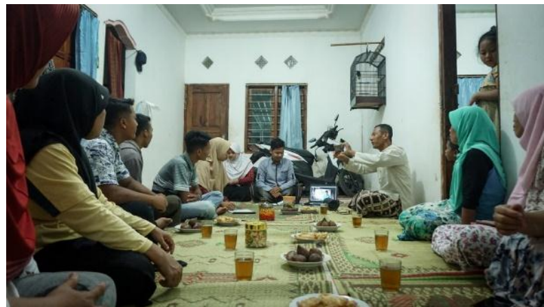
Gambar 4. Pembentukan Bank Sampah Singoyudan

Pembentukan Bank Sampah Singoyudan dilakukan pada tanggal 26 Januari 2020. Tujuan dari pembentukan Bank Sampah ini adalah untuk membahas beberapa hal terkait Administrasi Bank Sampah dan kepastian komitmen dari calon pengurus seperti ditunjukkan pada Gambar 4 . Pengurus dari Bank Sampah terdiri dari Karang Taruna dan ibu-ibu PKK. Adapun “Bhakti Eling Singoyudan” menjadi pilihan nama Bank Sampah Desa Singoyudan.