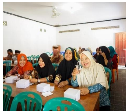
Gambar 2. Sosialisasi Bank Sampah di Desa