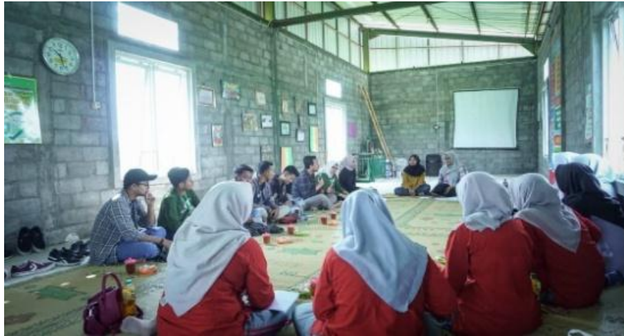
Gambar 3. Studi Banding dan Workshop di Bank Sampah Gemah Ripah