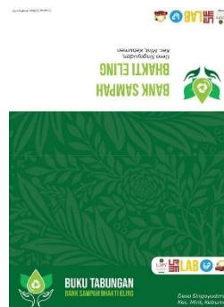
(b) Buku tabungan