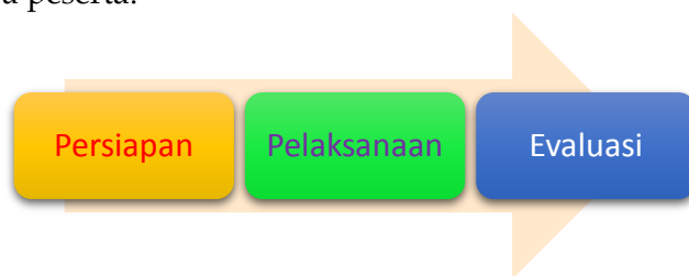
Gambar 1. Tahapan pelaksanaan kegiatan

Program PKM ini dilaksanakan pada tanggal 24 Juli 2021 melalui aplikasi Zoom . Sebanyak 35 (tiga puluh lima) guru PAUD yang berasal dari berbagai kecamatan di Kabupaten Purworejo mengikuti kegiatan penguatan literasi digital. Peserta kegiatan berusia antara 25-40 tahun dengan rata-rata pengalaman mengajar di tingkat PAUD antara 1-20 tahun. Narasumber kegiatan adalah tiga (3) dosen Program Studi Pendidikan Bahasa Inggris, Universitas Muhammadiyah Purworejo. Langkah-langkah kegiatan pelatihan mencakup tiga tahap: (1) persiapan, (3) pelaksanaan, (3) evaluasi. Tahap persiapan meliputi perizinan dan koordinasi dengan mitra, diskusi rencana kegiatan, dan penyiapan materi. Tahap pelaksanaan mencakup penyampaian materi dan diskusi seperti Gambar 1. Selanjutnya, tahap evaluasi meliputi wawancara terstruktur kepada para peserta.