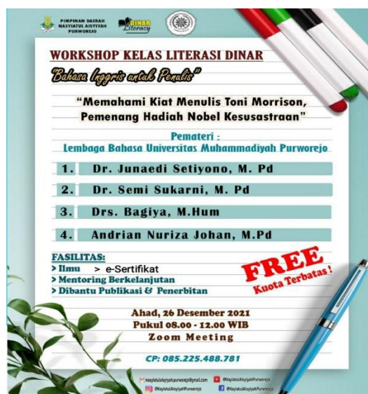
Gambar 2. Flyer Pengabdian Lembaga Bahasa

Setelah melalui tahap pertama, tim melakukan tahap kedua yaitu tahap pelaksanaan. Tahap ini terbagi menjadi tiga sesi yaitu pemaparan langsung, tanya-jawab, dan opini atau komentar peserta. Pada sesi pemaparan langsung, tim menunjukkan beberapa strategi penerjemahan dari bahasa Inggris ke bahasa Indonesia dan beberapa pengertian literasi digital yang erat kaitannya dengan pemerolehan teks-teks kiat menulis pemenang hadiah Nobel Kesusasteraan tersebut. Suasana kegiatan ditampilkan Gambar 3.