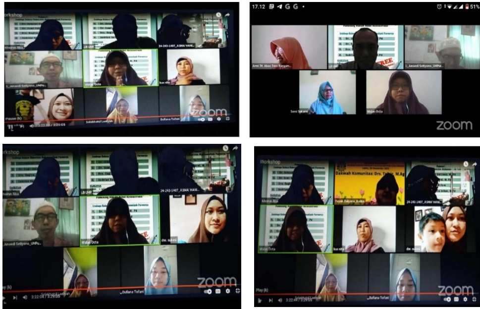
Gambar 3. Suasana Pemaparan Materi Pengabdian

Setelah sesi pemaparan dari tim selesai, sesi yang berikutnya adalah sesi tanya-jawab dan opini atau komentar. Di sesi ini, para peserta workshop melakukan tanya-jawab mengenai materi yang sudah selesai disampaikan. Setelah itu tim juga memberi waktu bagi peserta untuk memberikan opini atau komentar tentang materi yang sudah mereka terima. Pada sesi ini, narasumber menjawab pertanyaan dari peserta dan menanggapi opini atau komentar dari peserta kegiatan. Sesi selanjutnya, yang merupakan kelanjutan dari pemberian waktu bagi peserta untuk beropini atau berkomentar tentang materi workshop, dikhususkan untuk mencermati substansi umpan balik dari para peserta. Pencermatan dibagi menjadi tiga indikator ketercapaian yang meliputi ketertarikan pada penyampaian materi, pemahaman materi, dan pendapat mengenai pentingnya materi bagi kegiatan penulisan mereka.