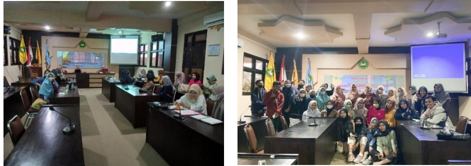
Gambar 5. Antusiasme Peserta Pelatihan