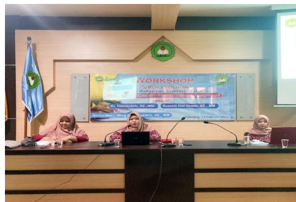
Gambar 2. Proses Pemaparan Materi