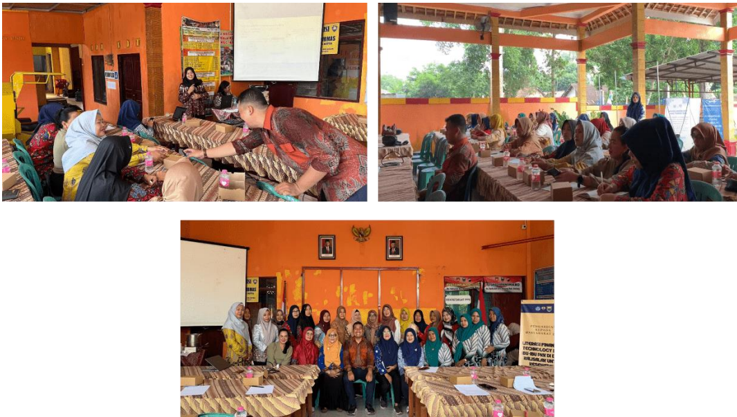
Gambar 7. Pelaksanaan Penyampaian Materi Pengelolaan Keuangan Keluarga Berbasis Teknologi Finansial

Dari hasil post-test yang dilakukan oleh 35 peserta, didapati rata-rata tertimbang yang paling rendah berganti kepada perencanaan pembelian rumah sebesar 2,69 persen dan nilai rata-rata tertinggi sebesar 2,89 persen yaitu perencanaan manajemen risiko. Secara keseluruhan, nilai rata-rata mengalami peningkatan sebesar 2,81 dengan kriteria cukup baik. Hasil ini sesuai karena dalam pengabdian kepada masyarakat ini pengelolaan keuangan berbasis teknologi finansial guna meningkatkan kondisi kesehatan keuangan keluarga. Peserta diajak untuk mengenali keuangan keluarga dengan mengidentifikasi pendapatan dan pengeluaran dalam tabel cash flow secara sederhana. Penentuan antara kebutuhan dengan keinginan dalam pengelolaan keuangan yang baik menjadi salah satu bahasan kegiatan pengabdian (lihat Gambar 7 ). Sehingga peserta mampu membuat skala prioritas yang disusun atas dasar tingkat kepentingan dan urgensinya. Selain itu, pengenalan atas pentingnya menyisihkan pendapatan untuk tabungan darurat dan bahaya hutang terutama hutang yang sifatnya konsumtif juga dibahas dalam kegiatan pengabdian kepada masyarakat ini.