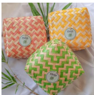
Gambar 1. Bentuk Besek d’Ketos

Penambahan warna dan aksesoris pada d’Ketos Bamboo Craft juga membuat terlihat lebih indah dan menarik perhatian konsumen, selain itu proses penambahan warna dan perebusan juga dapat memperlambat proses penjamuran. Keunikan dari d’Ketos Bamboo Craft adalah tahan lama, tidak mudah berjamur, lebih rapi anyamannya, menggunakan pewarna alami sehingga aman untuk kesehatan sebagai wadah makanan, serta harga yang ekonomis. Selain itu, d’Ketos Bamboo Craft juga memberdayakan pengrajin besek di dusun Ketos. Pengrajin besek ini nantinya akan berperan dalam proses membantu penganyaman d’Ketos Bamboo Craft . Hasil produk anyaman d’Ketos dapat disajikan pada Gambar 1 .