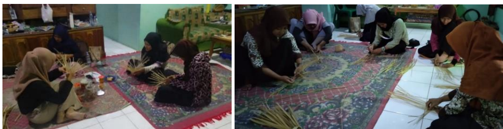
Gambar 2. Kegiatan Praktik Pembuatan Produk

Pada tahap pelaksanaan ini, berbagai program kegiatan yang sudah ditetapkan dilakukan dengan melibatkan partisipasi aktif seluruh anggota kelompok pengrajin untuk membangun, mengelola, dan membesarkan usaha produktifnya. Diberikan penjelasan kepada peserta mengenai dasar teknik membuat desain produk anyaman bambu, memberikan pengetahuan tentang cara mengimplementasikan desain menjadi produk jadi dengan di dukung dengan ketersediaan bahan dan alat, serta cara manajemen usaha agar bisa semakin berkembang dan maju. Kelompok pengrajin akan diberi kesempatan untuk mempraktikkan langsung sesuai dengan langkah-langkah yang telah didemonstrasikan dari awal penganyaman sampai menjadi produk jadi seperti ditunjukkan Gambar 2 .