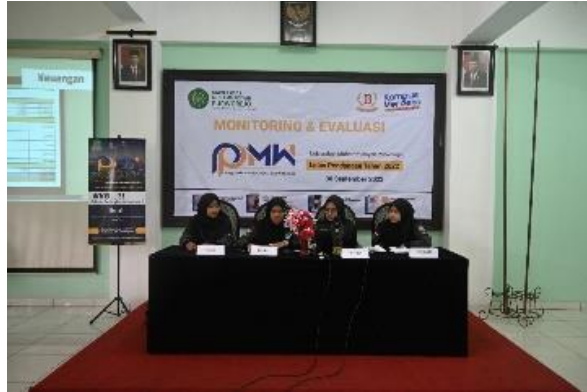
Gambar 3. Kegiatan Monitoring dan Evaluasi

Pada tahap ini juga dilakukan evaluasi sebelum produk dipasarkan. Instrumen yang digunakan dalam mengevaluasi adalah melalui observasi dengan melakukan perbandingan antara sebelum dan sesudah kegiatan dilaksanakan. Kegiatan dikatakan berhasil apabila terjadi peningkatan kemampuan, pengetahuan, dan keterampilan setelah kegiatan ini dilaksanakan.