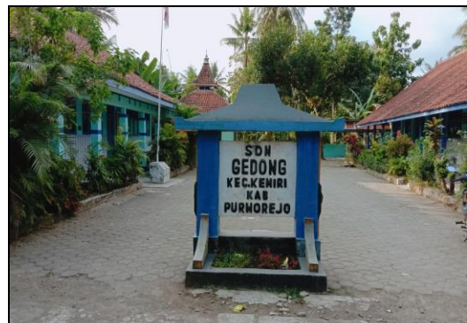
Gambar 2. Profil SD Negeri Gedong