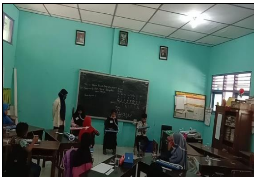
Gambar 1. Tes Praktek Ansambel Pianika