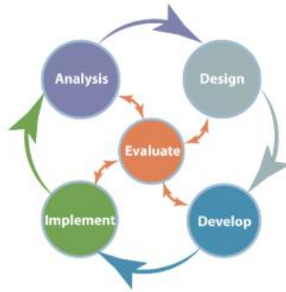
Gambar 2. Tahapan Pengembangan Rnd Model ADDIE

Pada tahapan analisis, dilakukan analisis terhadap tujuan pembelajaran, identifikasi lingkungan belajar, serta telah mendalam terhadap karakteristik dan kemampuan peserta didik. Selanjutnya dilakukan desain terhadap media yang dikembangkan. Desain menyesuaikan hasil fase analisis. Desain media yang dimaksud adalah dalam hal konten materi serta tampilan. Tahap desain harus sistematis dan spesifik, sistematis berarti menggunakan metode yang logis dan ilmiah, spesifikasi berarti desain yang disusun harus benar-benar memperhatikan detail sampai ke elemen-elemen terkecil.