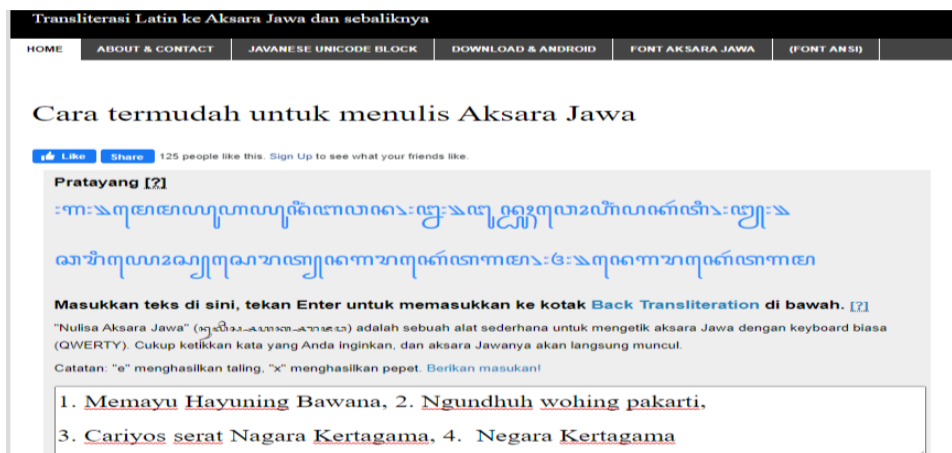
Gambar 1. Media Transliterasi Aksara Jawa

Dalam penelitian strategi transliterasi ini, peneliti melakukan pemanfaatan media yang tersedia secara luas di internet dan bebas untuk digunakan yaitu melalui laman yaitu https://bennylin.github.io/transliterasijawa/ pada gambar 1. Peneliti tidak membuat secara khusus media tersebut, tetapi memanfaatkan perangkat yang telah ada untuk memudahkan pembelajaran dan menguji tingkat ketercapaian tiap-tiap siklusnya. Namun demikian, media melalui laman tersebut tidak serta-merta di berikan saat pembelajaran. Mahasiswa diberikan kesempatan untuk mentranslasikan secara tertulis terlebih dahulu menggunakan kertas dari tulisan latin ke aksara Jawa maupun sebaliknya dari aksara Jawa ke tulisan latin.