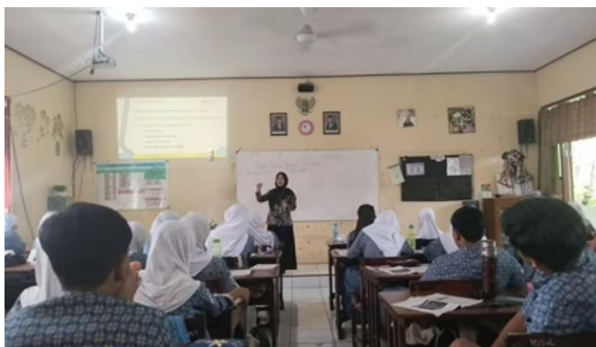
Gambar 1. Implementasi pendekatan CRT