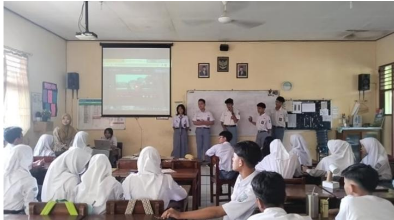
Gambar 3. Kegiatan presentasi kelompok