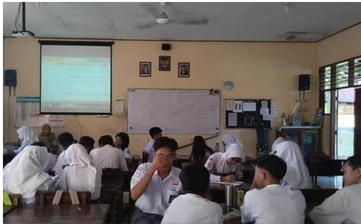
Gambar 2. Kegiatan berdiskusi kelompok