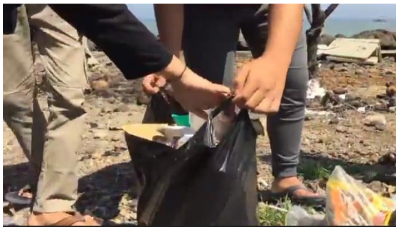
Gambar 4. Pelaksanaan aksi nyata