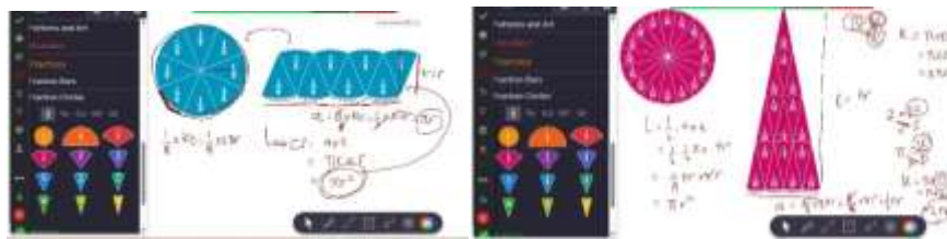
Gambar 2. Platform Mathigon mengubah bentuk lingkaran menjadi bentuk persegi panjang/jajar genjang dan segitiga.

Siklus III dilaksanakan dalam dua kali pertemuan, yaitu tanggal 18-19 Mei 2026 dengan total 4 JP. Pada tahap ini mahasiswa mencari luas lingkaran dengan membagi menjadi 8 atau 16 juring pada platform Mathigon kemudian disusun menjadi bangun persegi panjang, segitiga dan trapesium kemudian mencari luasnya hingga mendapatkan \pi \times r \times r .