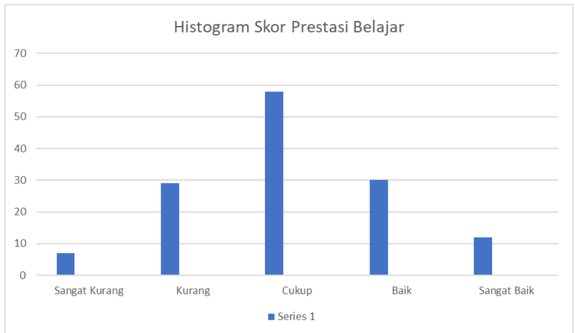
Gambar 3. Histogram Skor Prestasi Belajar

Histogram prestasi belajar diatas, diketahui bahwa sebagian banyak siswa di rentang nilai 81,91-84,38 dengan jumlah 58 siswa.